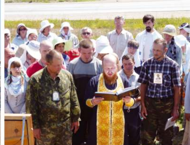
Мощи святителя Николая Чудотворца на Алтае 15 июля – 12 августа 2012 года