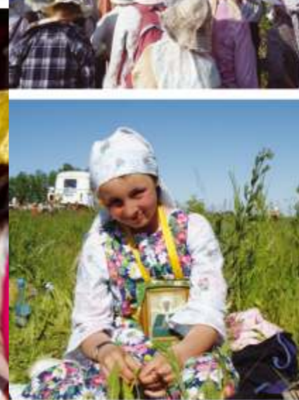
Крестный ход «Барнаул – Коробейниково» 24 июня – 1 июля 2012 года